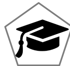
Unități de învățământ