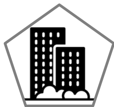
Clădiri de locuințe și birouri